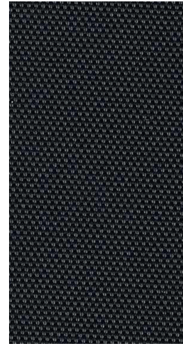
2864 | WHITE